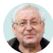
Václav Cílek geolog a esejista