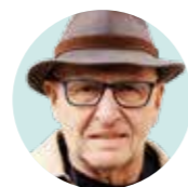
Ondřej Neff novinář a spisovatel