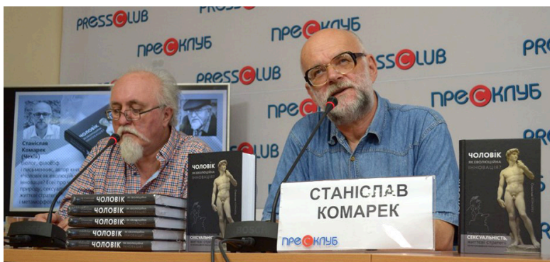
Із Юрієм Винничуком на презентації книжки «Чоловік як еволюційна інновація?» у Львові, травень 2019 р.

– Так, погоджусь... Ну, ми живемо у своєрідну добу. Я справді нічого подібного не зазнав за своє не таке вже й коротке життя. Це дещо нагадує нищівну повінь 2002 року, але тоді на Влтаву, що вийшла з берегів, можна було подивитися принаймні у телевізорі. А вірус – невидимий. Ще були «вугільні канікули» у січні 1979-го [тоді раптовий, упродовж однієї доби, перепад температури від плюс десяти до нижче мінус двадцяти, від дощу до морозів, спричинив тривалий енергетичний колапс – Пер.], але то не до порівняння. Настільки пара-